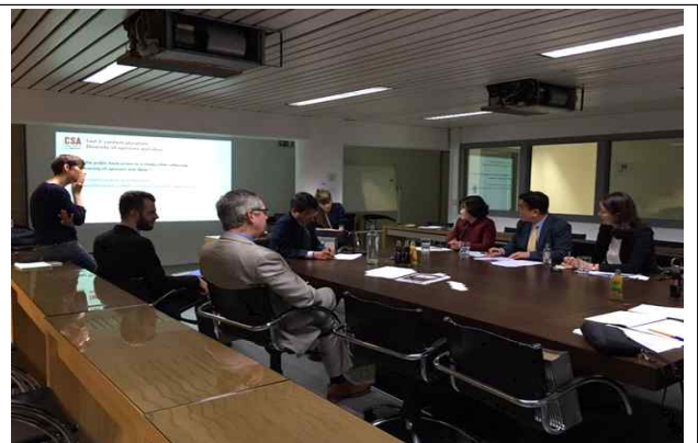
< CSA 위원장 면담 >