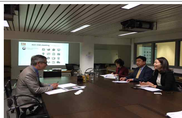
<CSA 위원장 면담>