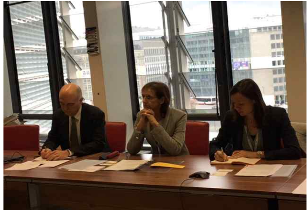
< EU 부총국장 면담 >