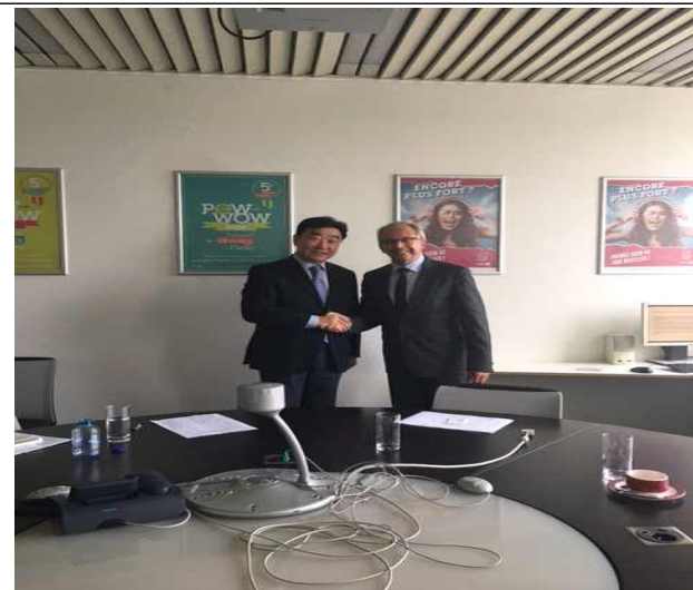
<기념 사진 >