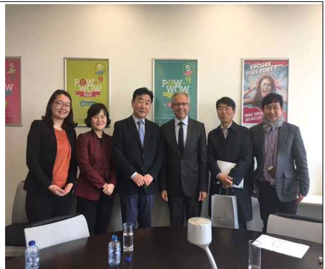
< 기념 사진 >