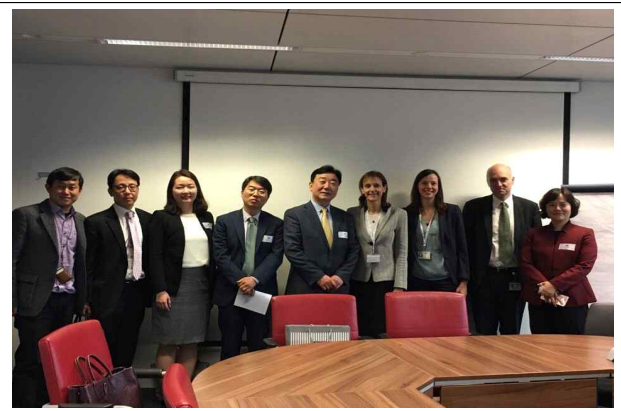
< 기념 사진 >