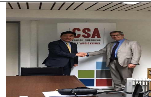
< 기념 사진 >