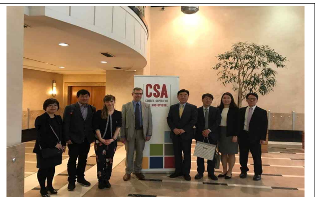
< 기념 사진 >