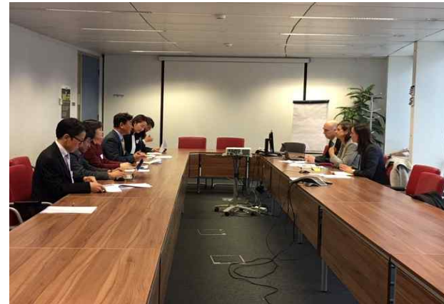
<EU 부총국장 면담>