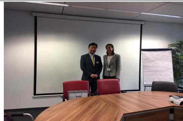
<기념 사진 >