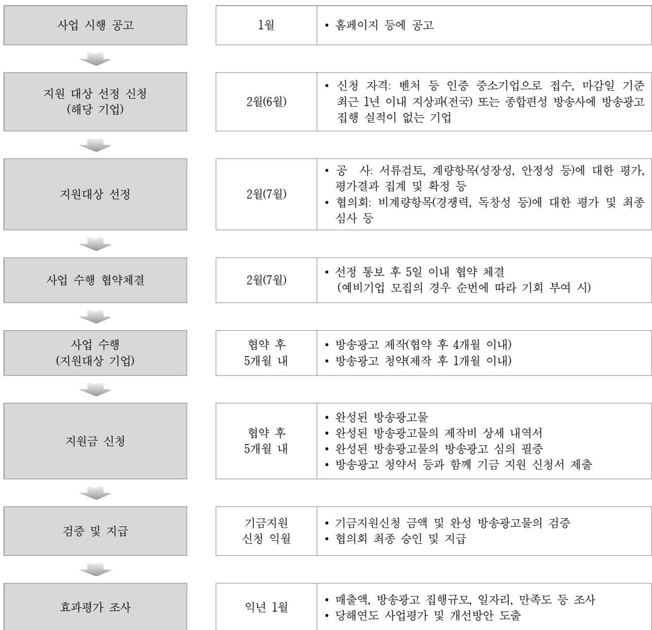
[그림] 사업추진 방법 및 절차

을 신청한 중소기업인 사업수행기관에 대한 계량·비계량평가 및 중소기업 방송 광고 활성화 지원협의회(이하 “협의회”라 한다) 심사를 거쳐 지원대상기업을 선정 하고, 선정된 지원대상기업이 방송광고를 수행(제작)한 후 방송광고 청약서 등과 함께 지원 신청서를 제출하면 협의회 최종 검증 후 해당 방송광고 제작비를 지원하고 있다.